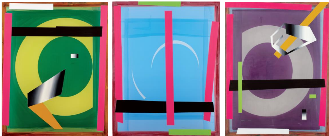
Pantallas de camuflaje (01 a 03), 2019

Esmalte y óleo sobre nailon emulsionado y aluminio