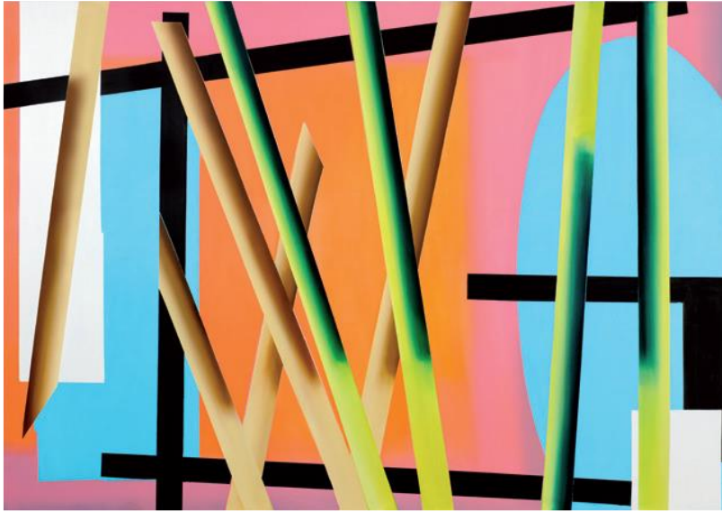
Sin título, de momento, 2019