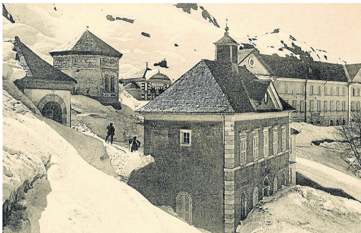
El balneario de Panticosa en el invierno de 1915. FRANCISCO DE LAS HERAS